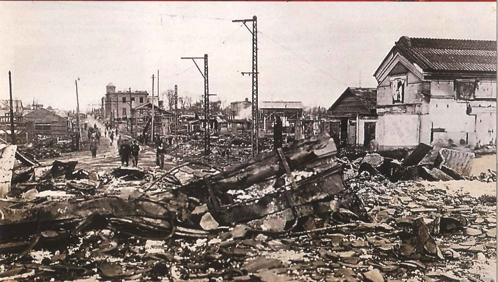
水戸駅前炎上図[上]/水戸空襲後の水戸市南町方面[下]