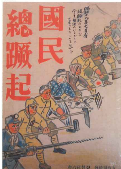
ポスター 昭和19年7月のポスター。戦争にむけて国民が団結するよう、いろいろな標語を用いてポスターが作られました。昭和19年ごろは、戦争の状況が厳しくなってきたことが、ポスターの図柄からもわかります。