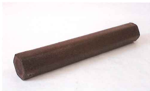
焼夷弾 日本の家屋のほとんどが木造だったため、アメリカ軍は火災を起して街全体にダメージを与える攻撃をしようと、大量の焼夷弾を使いました。雨のように降ってくる火のついた鉄の棒で水戸市街も火の海となり、当時の水戸市の8割が燃えました。