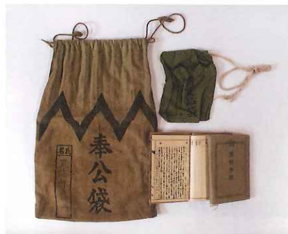
奉公袋 陸軍の入営や、戦地に向うときに、必要なものを入れた袋。自分の履歴を記した軍隊手帳や召集令状なども入れました。