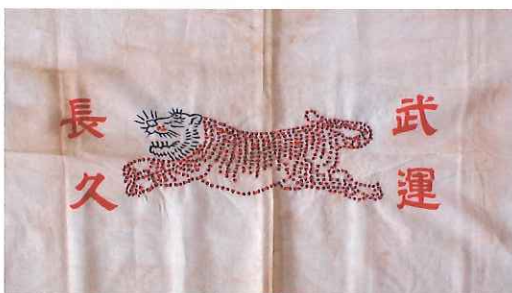
千人針 戦場に向う兵士の武運長久(戦いでも命を落さないこと)を折ってつくられたもの。白い布に赤い糸で、一人一針ずつ玉留めを作りました。(鉄砲の弾止め)の折りを込めています。「千里を行って千里を帰る」という縁起の良い虎の絵がよく使われました。