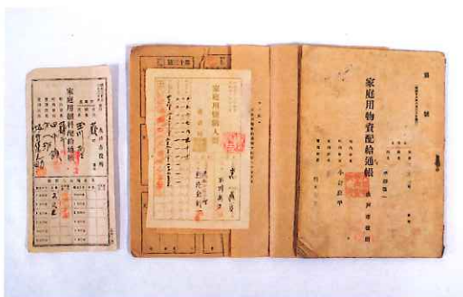
配給手帳 全ての物資が軍隊優先で、国民は制限された生活を強いられました。食料、衣類、燃料も世帯ごとに配られる量が決められていました。