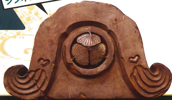
二の丸角櫓跡出土三つ葉葵紋鬼瓦(水戸市埋蔵文化財センター所蔵)