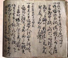
「当用手控」(茨城町教育委員会所蔵)