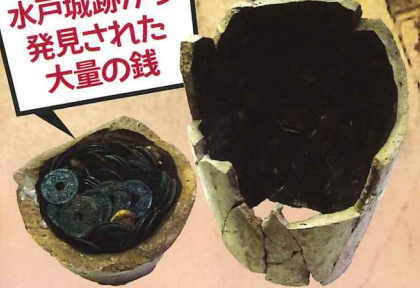
埋納銭(水戸市埋蔵文化財センター所蔵)