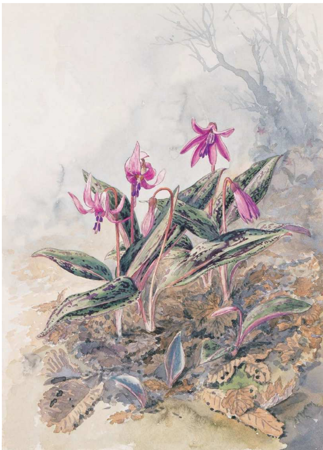
《高山植物写生図 カタクリ》水彩／紙