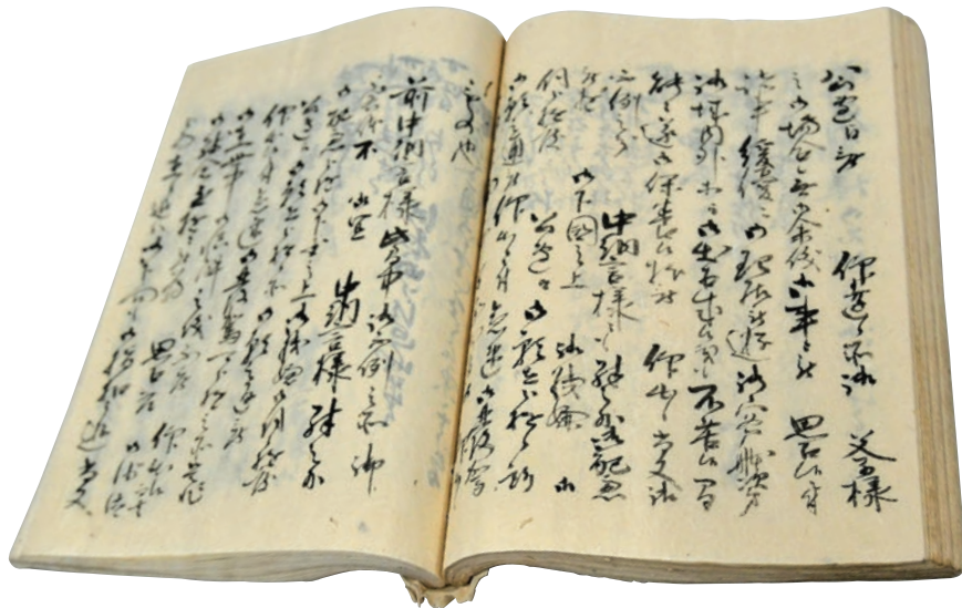
▲小泉家日記(市立博物館蔵)…小泉家の代々の当主によって書かれた35冊の日記。この日記を含め、手紙など、900点以上ある小泉家文書は、当時の水戸の商家の動向を明らかにするうえで貴重な史料として、水戸市指定文化財に指定されています。

幕末から大正期に、水戸の商人によって記された小泉家日記。つづられた言葉の一つ一つから、当時の息遣いが聞こえてくるかのようです。 問合せ／市立博物館(☎226・6521)