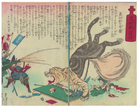
▲虎列刺(コレラ)退治(東京都公文書館所蔵)…コレラはトラ、オオカミ、タヌキが合体した妖怪の姿で記録に残され、当時の人々の恐怖心が伝わってきます。水戸では、「コリ狐」として、キツネの姿で現れたとされています。

例えば、幕末に流行した伝染病コレラ(コリ)について、文久2(1862)年8月の日記には、コレラとともに「薄氷を踏む心地」であると書かれています。近隣のお寺で行われた葬儀の数のほか、「コリ狐」が現れ