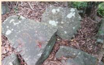
水戸城を石垣にする計画があった!? 「伊豆の水戸藩石丁場」関連資料