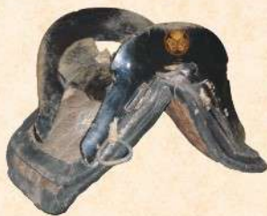
頼房の奉納品？ 葵の紋が施された鞍 「ヤンサマチ使用馬具」

徳川家康の11男として誕生した初代水戸藩主頼房は、水戸徳川家及び水戸藩の基礎を固めていきました。その活動の場は水戸だけに限られず、居住していた江戸、誕生の地京都など全国に広がります。本展覧会では、59年にわたる頼房の生涯を、ゆかりの品とともにとどめます。また、頼房が造立を命じた水戸東照宮の創建400年を記念して、水戸東照宮に伝わる宝物、水戸東照宮祭礼絵図などを多数公開します。