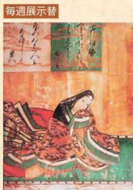
毎週展示替 水戸東照宮創建時に 奉納された36人の 歌名人の肖像画 「三十六歌仙扁額」 水戸東照宮所蔵 (茨城県立歴史館寄託)