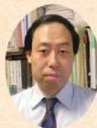
講師: 白根孝胤 (中京大学教授) 白根先生には当日、 オンライン上で講演 していただきます。

日時: 令和3年11月3日(水・祝) 13:30~15:00 講演方式: オンライン視聴 参加方法: ①博物館2階展示室における上映会に参加(30名) 募集: 10月13日(水)9:00から電話受付、先着順 ②Zoomミーティングによるオンライン参加(50名) 募集: 当館ホームページ上でご確認ください