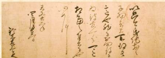
今川・井伊・伊達・佐竹、 水戸藩家臣が伝えた 戦国武将の古文書 「今川義元朱印状」 個人蔵(水戸市立博物館寄託)