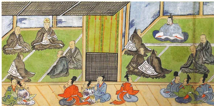
江戸氏家臣が制作に関わった絵巻物 「弘法大師行状図画」(部分) 水戸大師大地蔵寺所蔵 茨城県指定文化財