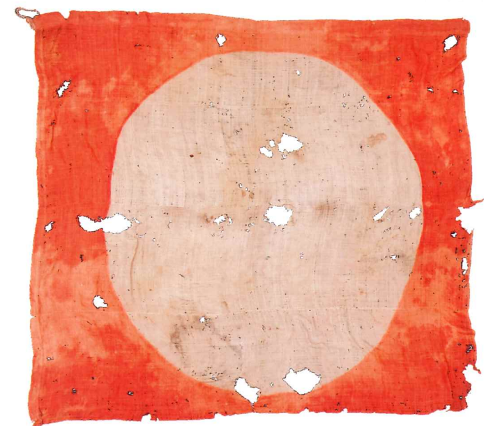
笠間に侵攻した江戸氏との戦いで使用されたと伝わる旗 「戦旗」 個人蔵 笠間市指定文化財