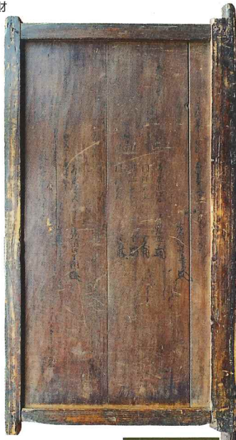
戦場に向かう 江戸氏一族が和歌を書きつけた扉 「小生瀬宝泉寺扉」 妙徳寺所蔵