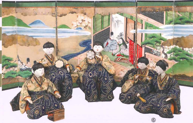
①享保雛(男雛) ②牛乘天神(小幡土人形) ③押絵羽子板(小野道風) ④押絵羽子板(藤娘) ⑤雛人形(富山土人形) ⑥享保五人囃子

様々な人形に込められた子どもの健康と幸福を願う思いを感じていただければ幸いです。