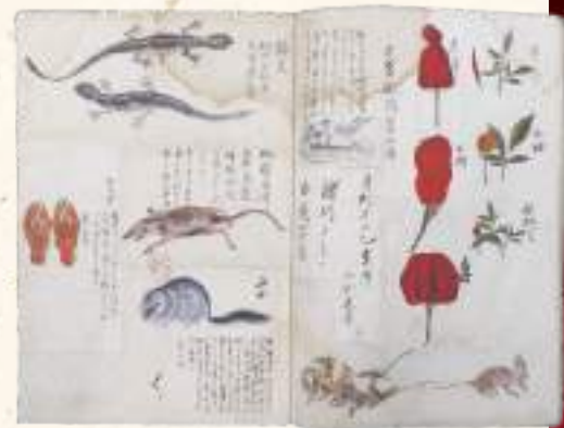
徳川斉昭画「庶物会要撰録」