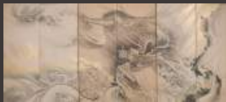
櫻井雪保「龍虎図屏風」(六曲一双) 水戸市立博物館所蔵